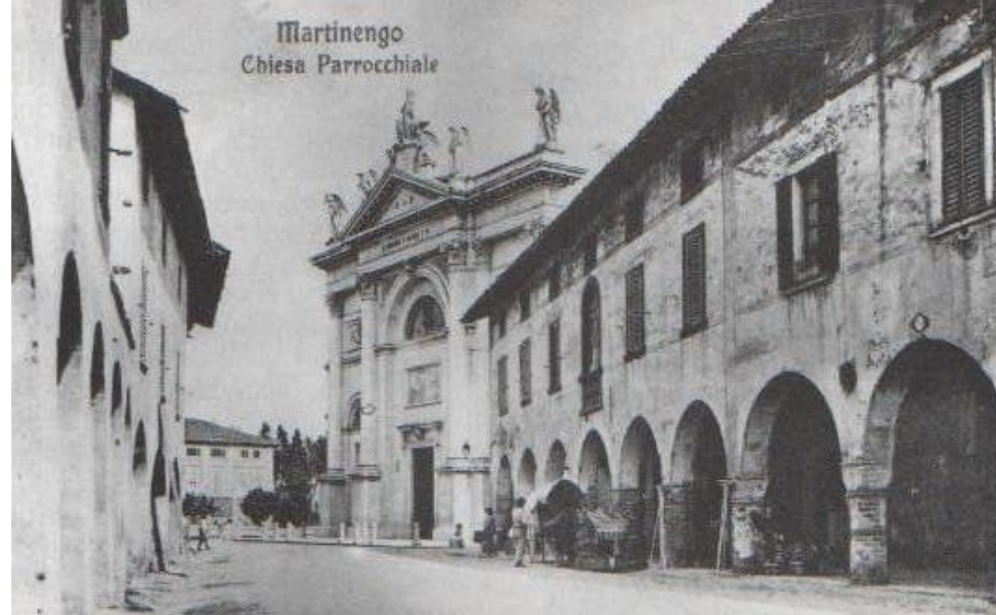
Martinengo Chiesa Parrocchiale